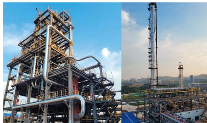
Photographie de l'usine Shunli

En octobre 2022, Carbon Recycling International a achevé la mise en service d'une nouvelle usine de production d'e-méthanol en Chine. D'une capacité de production de 110 000 tonnes d'e-méthanol par an (contre 200 000 tonnes pour eM-Lacq), il s'agit de la plus grande unité de production d'e-méthanol en opération.